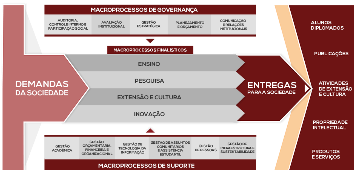
Figura 1 - Cadeia de Valor da Universidade Federal de Viçosa