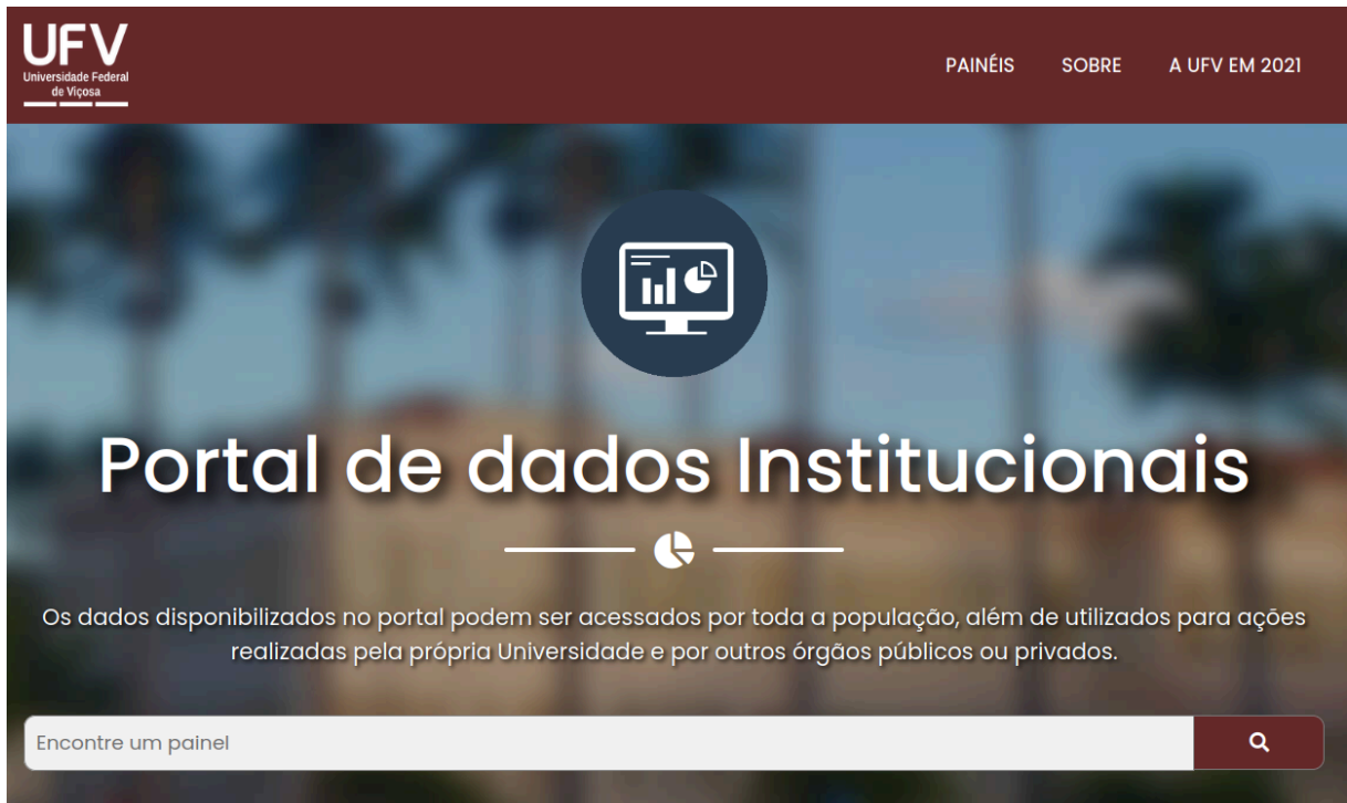
Figura 7 - Portal de Dados Institucionais