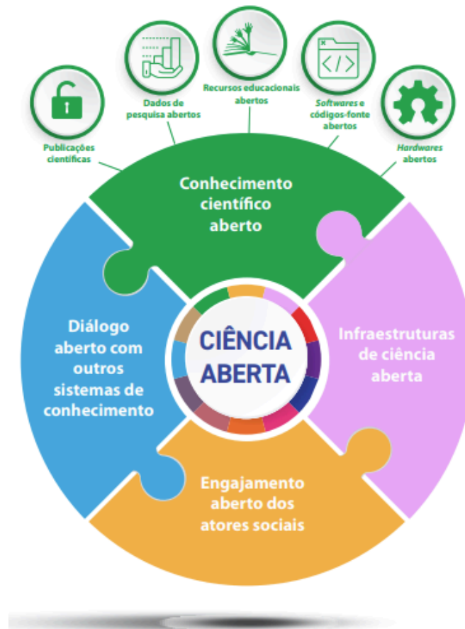
Figura 2 - Componentes do conhecimento científico aberto

A ciência aberta, conforme estabelecido na Recomendação da Unesco de 2021 , representa um novo paradigma de produção, disseminação e utilização do conhecimento científico, baseado nos princípios da transparência, reprodutibilidade, colaboração e acesso equitativo às evidências e resultados da pesquisa científica. Nesse contexto, o diagnóstico realizado pela UFV constitui uma etapa fundamental para mapear os ativos informacionais da pesquisa institucional, apoiar sua gestão e subsidiar políticas de abertura progressiva e responsável dos dados científicos.