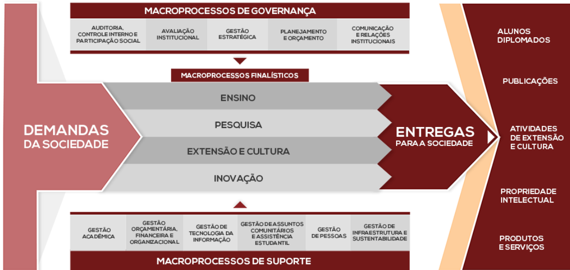
Figura 1 - Cadeia de Valor da Universidade Federal de Viçosa