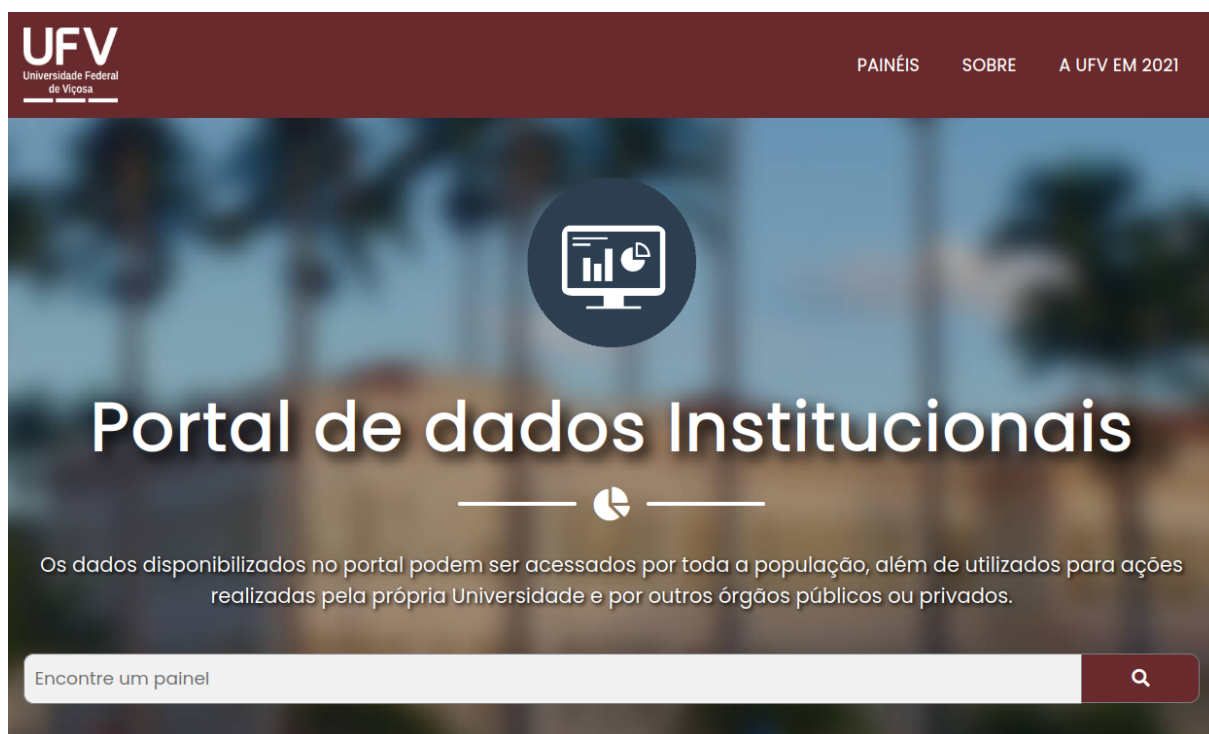
Figura 5 - Portal de Dados Institucionais

Já a disponibilização dos referidos dados em formato de painéis será realizada no Portal de Dados Institucionais .